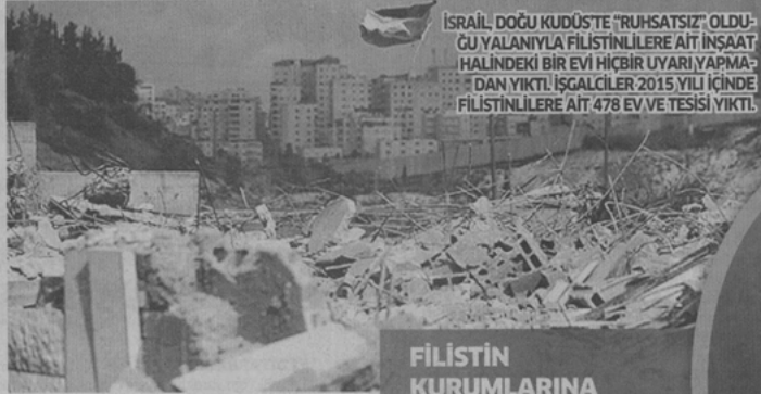
İSRAİL DOĞU KUDÜSTE "RUHSATSIZ" OLDUĞU YALANIYLA FİLİSTİNLİLERE AİT İNŞAAT HALİNDEKİ BİR EVİ HİÇBİR UYARI YAPMADAN YIKTI. İŞGALCİLER 2015 YILI İÇİNDE FİLİSTİNLİLERE AİT 478 EV VE TESİSİ YIKTI.

► İŞGALCI İsrail'in Batı Şeria ve Doğu Kudüs'te Yahudi işgalciler için 55 bini aşkın yeni konut inşa etmeyi planladığı belirtildi. İsrail'de bulunan ve Filistin topraklarındaki Yahudi işgal birimlerine ilişkin çalışmalar yapan Es-Selam el-An adlı sivil toplum kuruluşunun yayımladığı raporda, "İsrail İskân Ekanlığı, Doğu Kudüs de dâhil Batı Şeria'da 55 bin 548 yeni işgal birimi yapılmasını planlıyor" denildi. Konutların yaklaşık yansının ayırım duvarından doğuya doğru olan bölgelerde inşa edilmesinin planlandığı belirtilen raporda ayrıca E1 planı çerçevesinde yapılması planlanan konutlardan 8 bin 372'den fazlasının "Eyyu Vahid" bölgesinde inşa edilme aşamasında olduğu kaydedildi. Filistin Kurtuluş Örgütü İcra Kurulu Üyesi Hanan Aşravi de yazılı açıklamasında, Yahudi işgal birimleri inşası planlarına işaretleterek, "İsrail'in Batı Şeria topraklarını gasp ederek işgal birimleri faaliyetlerini genişletmesini" knadı.